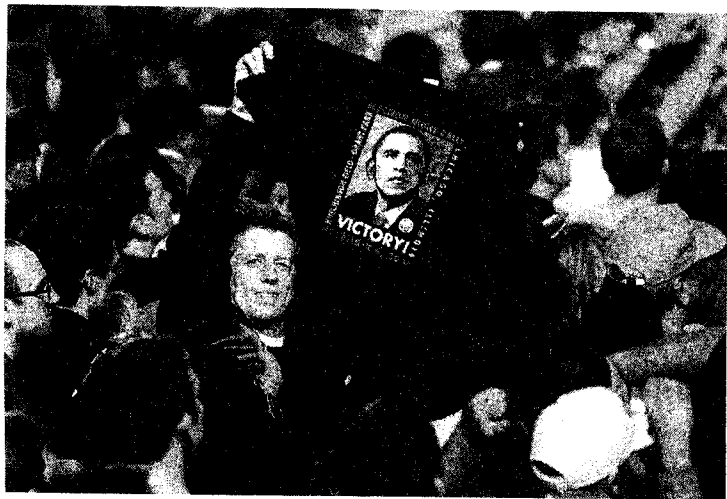
米大統領選でのオバマ氏勝利を喜ぶ支持者＝4日夜、シカゴ